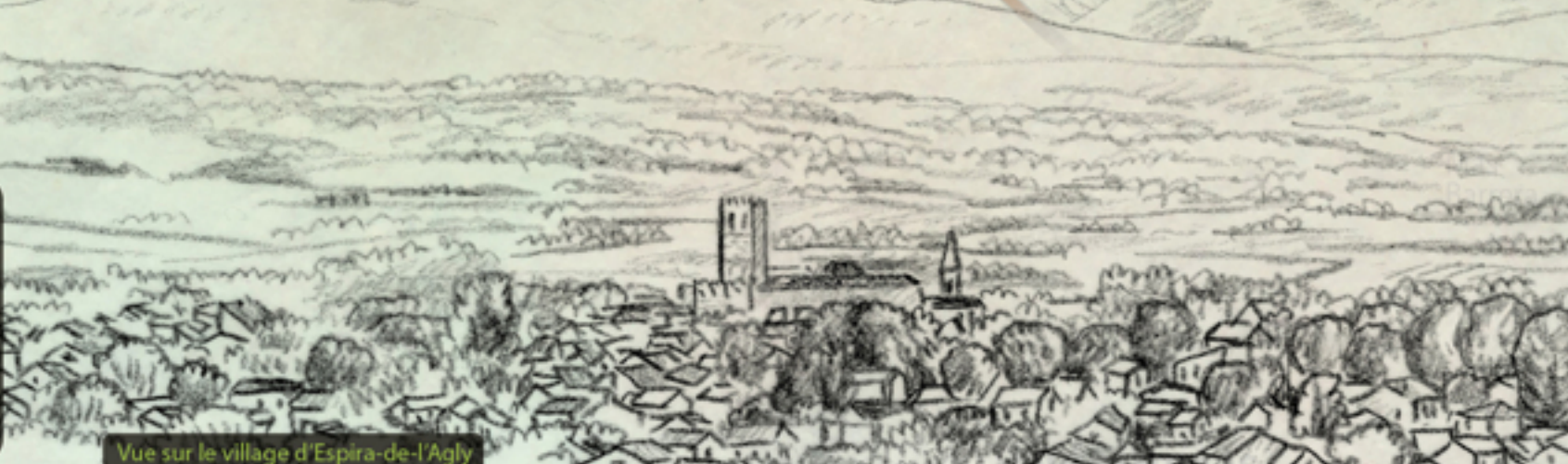
Vue sur le village d'Espira-de-l'Agly