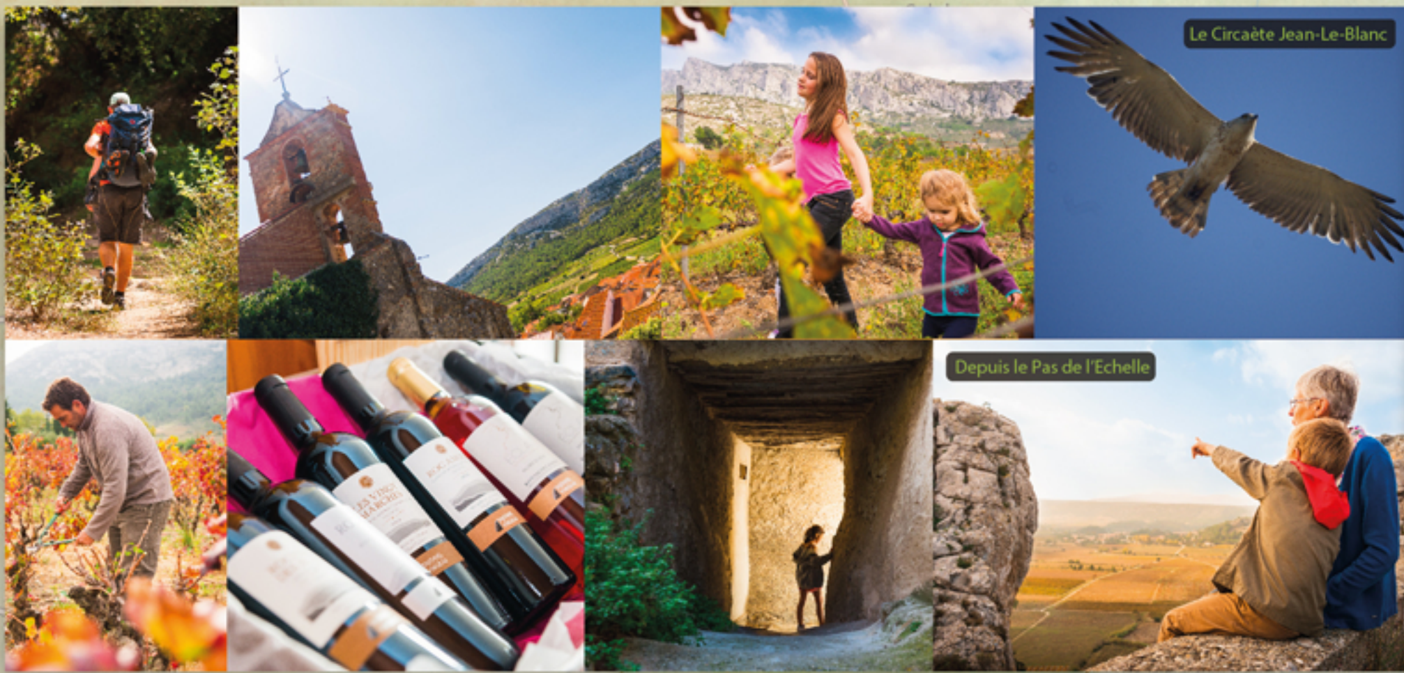
Le Circaète Jean-Le-Blanc